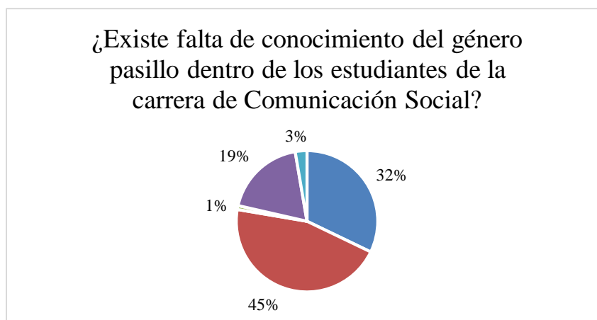
Figura 3. Género pasillo dentro de la carrera de comunicación social