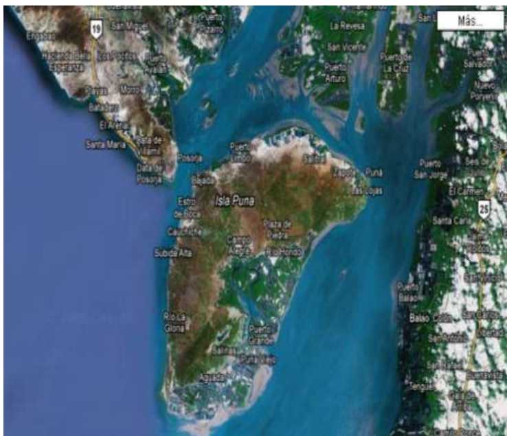
Figura 1. Vista Satelital de Isla Puná.

Fuente: Elaboración propia a partir de Inocar (2019).