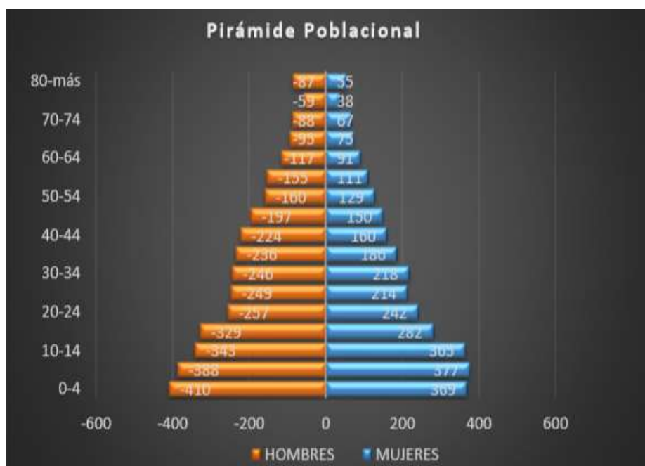
Gráfico 2. Pirámide de la población residente en la Isla.