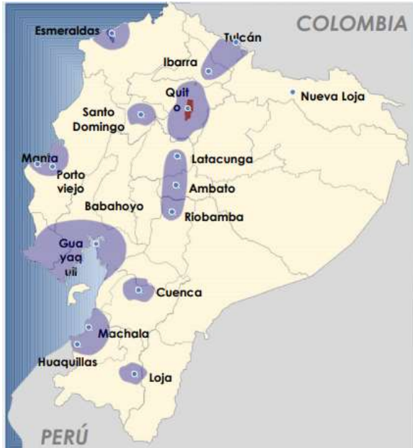
Figura 1. Zonas Especiales de Desarrollo Económico