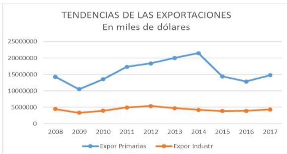
Gráfico 2. Tendencias de las exportaciones en miles de dólares.

En cambio, Colombia y Perú, vecinos y principales competidores en el mundo, sus registros superan los 10 mil millones de dólares. La industria de América Latina tiene varias convergencias y se debe principalmente a los diferentes tipos de estrategias que van desde la mejora de la competitividad, productividad, acuerdos comerciales, leyes que fomenten la producción industrial como las Zonas Francas, Parques Industriales y Zonas Especial de Desarrollo Económico.