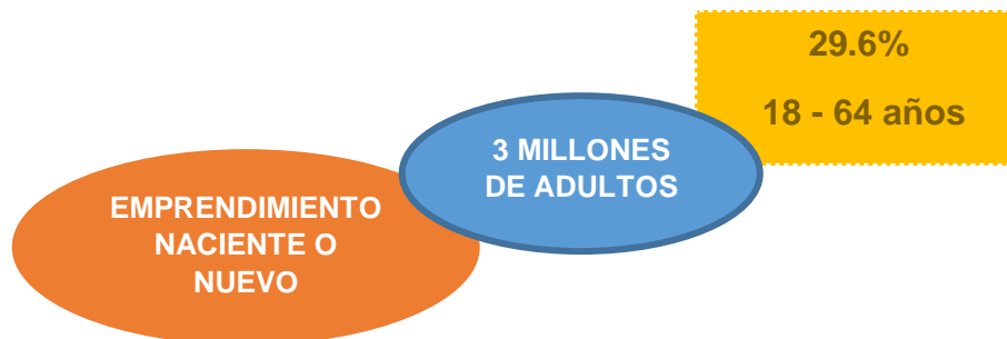
Gráfico 2: Muestra de la población.

Según los datos estadísticos de la encuesta del informe GEM Ecuador 2017, “recogió información de 2,060 personas en edad adulta y 37 expertos nacionales, lo que permitió identificar y analizar las características de la actividad emprendedora en el país”. (Global Entrepreneurship Monitor (GEM), 2017). Por lo tanto, permite obtener información actualizada y puntual acerca de la temática.