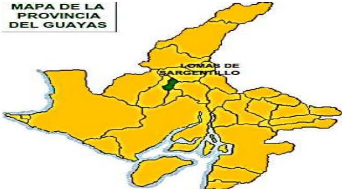
Figura 3. Ubicación del Cantón Lomas de Sargentillo a nivel del Guayas.

Fuente: (GAD del municipio de Lomas de Sargentillo, 2017)