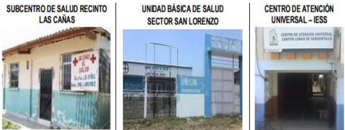
Figura 1. Centros de Salud cercanos a Lomas de Sargentillo.