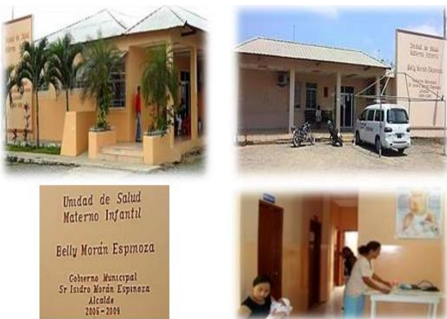
Figura 2. Unidad Materno Infantil municipal de Lomas de Sargentillo.

La situación de la salud es escasa, apenas existen cuatro sub centros de salud, uno está ubicado en la cabecera cantonal de Pedro Carbo, y el otro en el sector de San Lorenzo, construido por la prefectura, otro centro está construido en el sector de la zona rural, en el recinto las Cañas, y un centro de atención del IESS.