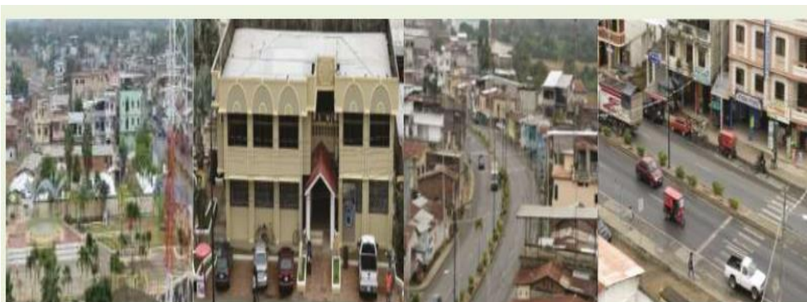
Figura 1. Sector principal y comercial del sector de Lomas de Sargentillo.

El nombre de Lomas de Sargentillo nace desde el año 1894, quienes son sus pobladores manifiestan que existía un militar del equipo del General Eloy Alfaro, que justo en el momento de defender la doctrina liberal, dicho militar se accidento en lo que se denominada el sector de la “Las Golondrinas”, desde ahí se realizó como morador del sector, contrayendo matrimonio, y teniendo un hijo a este se lo denomina “Sargentillo”, y por el hecho de que la población estaba apostada en tierras altas, de ahí su nombre.