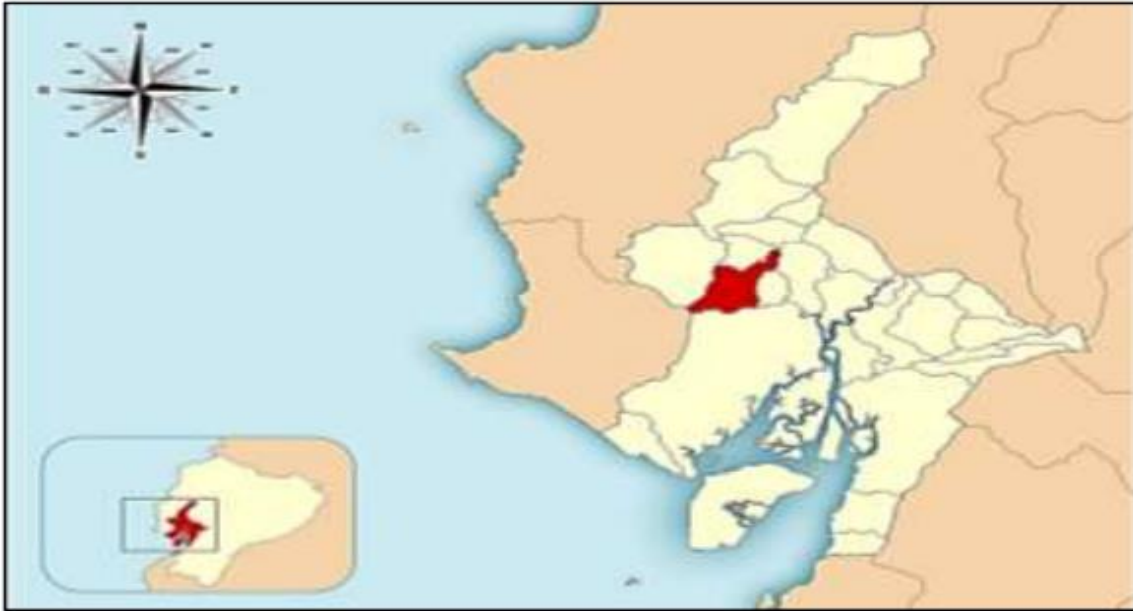
Figura 2. Ubicación del Cantón Lomas de Sargentillo a nivel nacional.