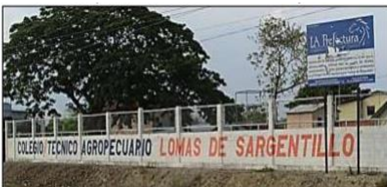
Figura 4. Colegio Técnico Agropecuria de Lomas de Sargentillo.

La educación fiscal mantiene una presencia alta en la comunidad, donde con un promedio de 42 aulas de clase se educan alrededor de 3930 estudiantes, la diferencia es que la calidad es un atenuante que da mucho que desear en las entidades investigada, e incluso al comparar el número de aula es distinta en la educación secundaria fiscal y la básica inicial, pero la diferencia es que en la entidad básica los estudiantes son 1272 y en la educación fiscal secundaria se triplica el número a pesar de mantener el mismo nivel de aula. La educación es inequitativa porque en un aula de la entidad básica inicial se educa un promedio de 25 a 30 estudiantes, sin embargo, en la entidad estatal son aulas que alberga hasta 70 estudiantes.