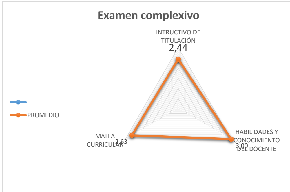
Figura 2. Percepción de los alumnos sobre la modalidad del examen complejo.