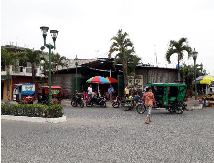
Figura 1. Centro comercial Santa Ana.

durante todos los días, en especial los fines de semana. Los pobladores de los recintos llegan hasta la misma a provisionarse de alimentos y vestuario en la medida de sus posibilidades.