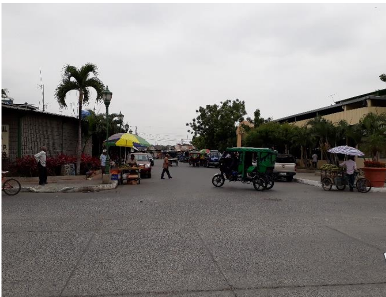
Figura 2. Mercado de la Cabecera Cantonal.