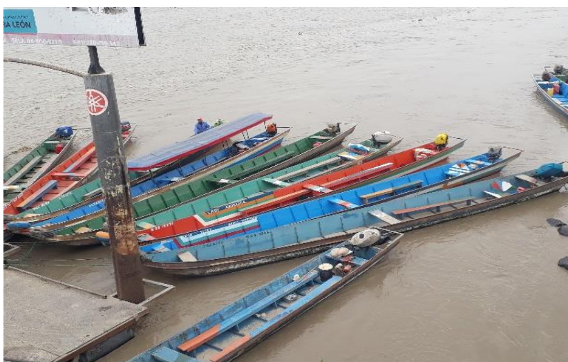
Figura 4. Canoas-Río Babahoyo-Malecón.