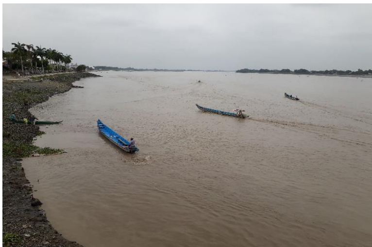
Figura 3. Canoas-Río Babahoyo-Malecón.

Babahoyo, en el cual se puede acceder al transporte fluvial (canoas) para llegar a los distintos recintos y la transportación de mercadería y desde las diferentes piladoras que quedan al otro lado del río.