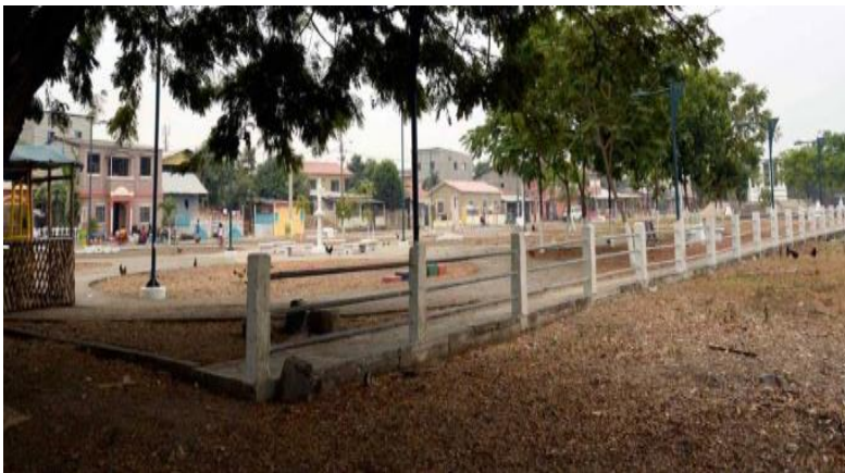
Figura 7. Buijo Histórico.

La zona rural se encuentra dispersa en los denominados recintos 4 , los cuales se encuentran en medio o cercanos al campo o zona agrícola, no están distantes de las zonas con mayor concentración de población y en algunos casos se encuentran inmersos entre las poblaciones urbanas, tal como es el caso del Recinto “El Buijo Histórico” el cual es considerado el más grande del cantón, al estar conformado por alrededor de 540 familias. Este queda en el Kilómetro 10 de la Vía a Samborondón y 3 kilómetros hacia el interior, junto a una zona residencial denominada “Ciudad Celeste” y “El Cortijo”, esta última urbanización que es la primera del sector en sus inicios estaba conformada por casas de campo de gente adinerada de Guayaquil, a las cuales iban fines de semana (Diario El Universo, 2019).