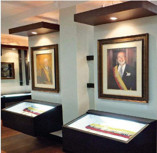
Figura 11. Museo de los Presidentes ubicado en la Universidad de Especialidades Espíritu Santo Ciudad Satelital, Vía a Samborondón