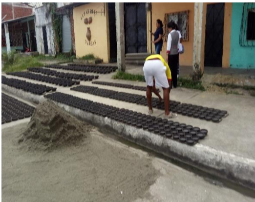
Figura 5. Trabajos de Alfarería.