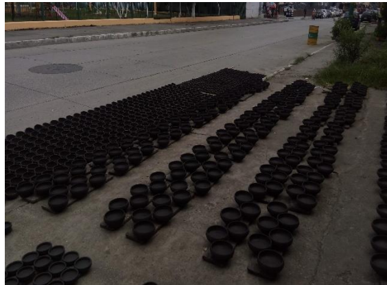
Figura 6. Trabajos de Alfarería.