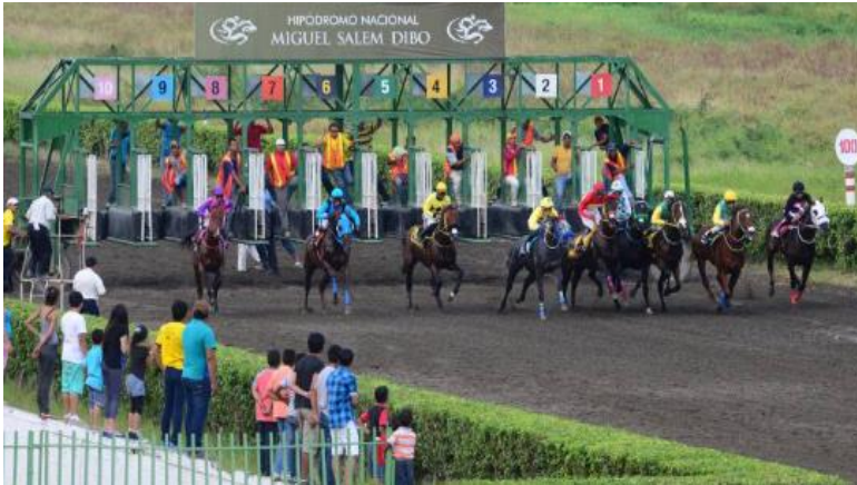
Figura 8. Hipódromo el Cortijo.

observa en varios residentes mucha pobreza. Este poblado está al pie del río Babahoyo. Se observa en su calle principal algunos locales de personas externas al poblado que han puesto locales comerciales dirigidos a clientes del sector residencial cercano. Como a un kilómetro, se encuentra el Hipódromo “El Cortijo”, en el cual se hace corridas y apuestas a los caballos.