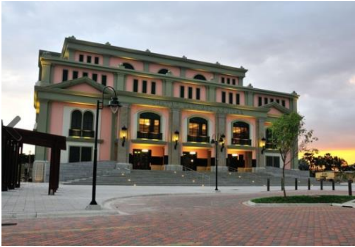
Figura 9. Hipódromo el Cortijo.

con más recepción de capitales en el país, sólo superado por Guayaquil. (Samborondón GAD, 2019).