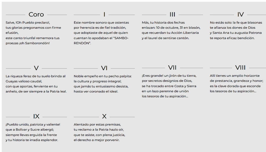
Figura 4. Himno del cantón Samborondón.

Elementos que, sin duda, sintetizan los aspectos claves, del orgullosamente conocido como montubio de Samborondón.