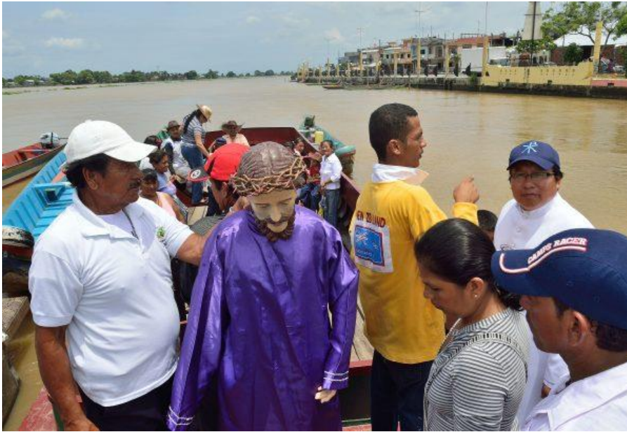
Figura 2. Vía Crisis Acuático anual.

Fuente. (Gobierno Autónomo Samborondón, s.f.)